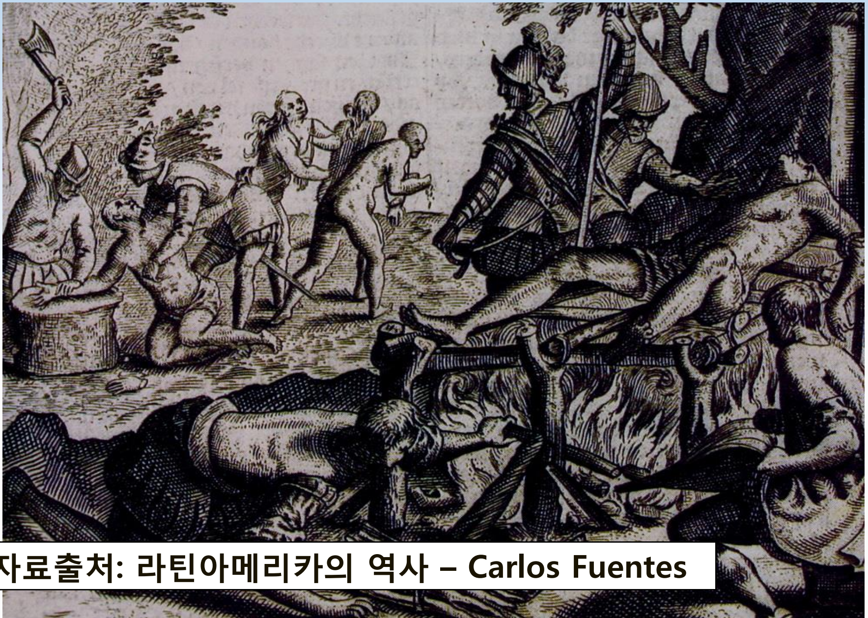
자료출처: 라틴아메리카의 역사 – Carlos Fuentes