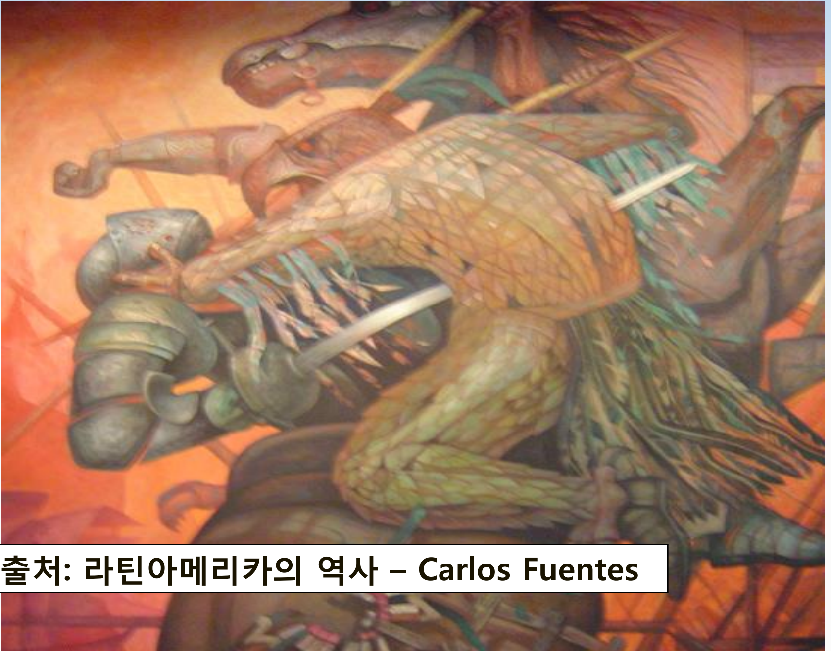
자료출처: 라틴아메리카의 역사 – Carlos Fuentes